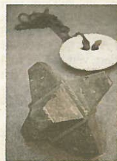
Kryss inspirerade av afrikanska guldvägar.